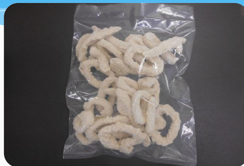
イカリングフライ※皮・耳付き