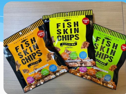
フィッシュスキンチップス