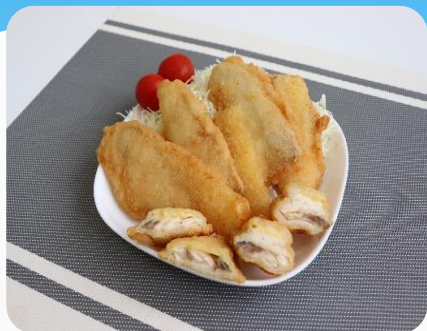
サーモンチーズカツレツ